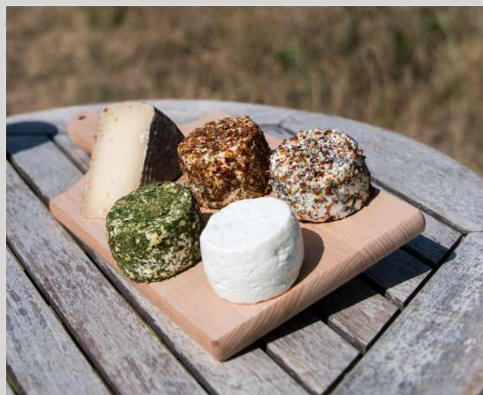
La Maison des Biquettes

Implantée sur une ancienne cressonnière au sein de laquelle circule, depuis des décennies, une eau de source des plus pures, cette exploitation bénéficie de conditions idéales d'élevage de truites et de saumons, avec un savoir-faire reconnu. Tél. : 03 25 01 97 78 ou 06 70 91 11 43