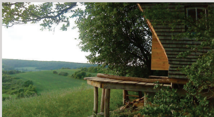
Les cabanes perchées d'Auberive