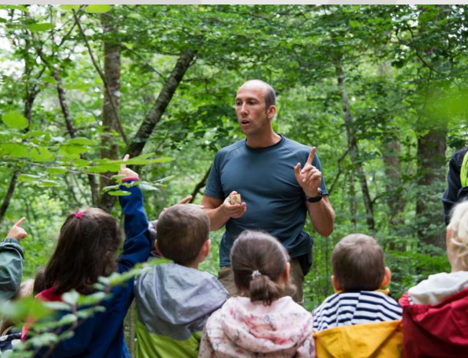
Maison de la Forêt

Le Centre d'initiation à la nature d'Auberive invite à des immersions variées et originales dans la nature qui sont support de découvertes et de questionnements. Classes découvertes, chantiers participatifs, activités pour familles et groupes lors de week-end thématiques... Leurs ânes peuvent prendre part aux découvertes proposées ! Tel. : 03 25 84 71 86 / 06 98 91 71 86 https://chemindetraverse52.org/