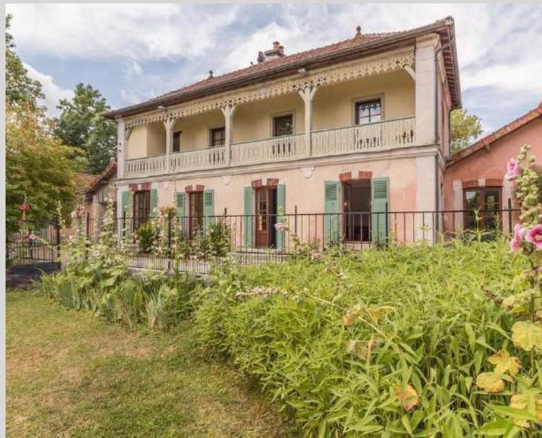
La Villa des Promenades