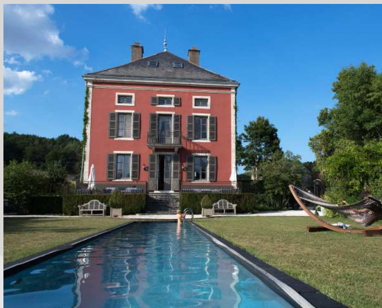
Château de Courban