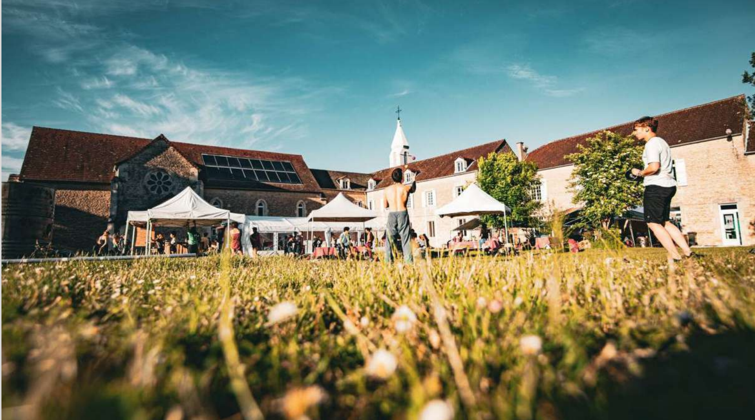
Maison de Courcelles