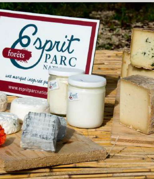
GAEC de Conclois