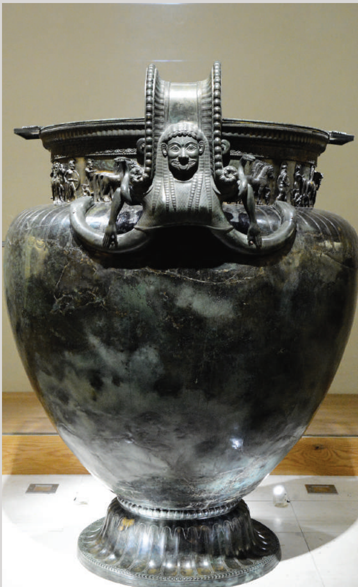
Le cratère de Vix