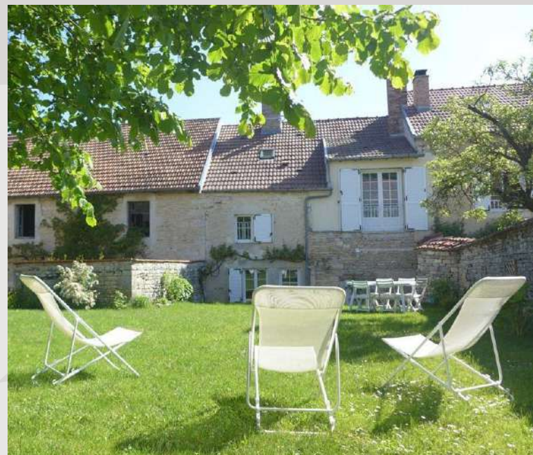
La Maison de Gabrielle