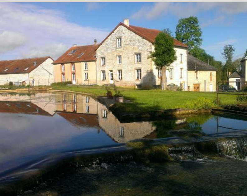
Moulin de la Fleuristerie