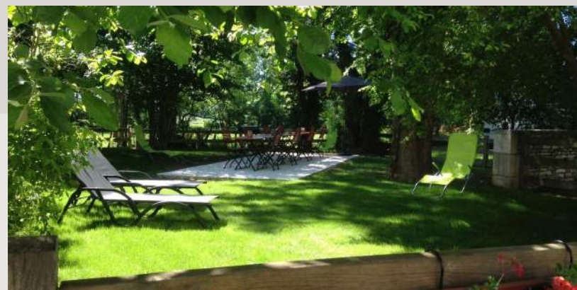
Le Nid de Cigognes