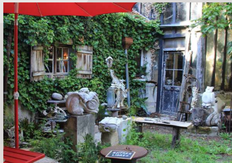
Café culturel associatif