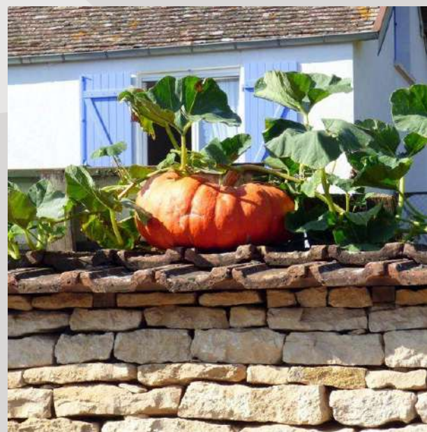
Gîte Pollen et Propolis