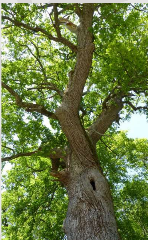
Chêne - Arc-en-Barrois

Les parcs nationaux ont pour vocation la protection et la valorisation de la nature, des paysages et des patrimoines culturels. Ils ont aussi pour mission de produire et diffuser de la connaissance. Ce sont donc de véritables laboratoires au service des scientifiques. L'accueil du public et l'éducation à l'environnement et au développement durables constituent des priorités des parcs nationaux. Ce sont aussi des territoires exemplaires pour la transition écologique et le développement durable.