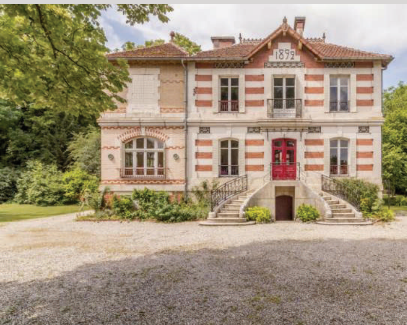
La Villa 1892 et La villa des Promenades