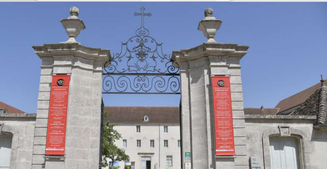
Musée du Pays Châtillonnais - Trésor de Vix

Tél. : 06 88 33 23 29 - www.viefrancigene.org