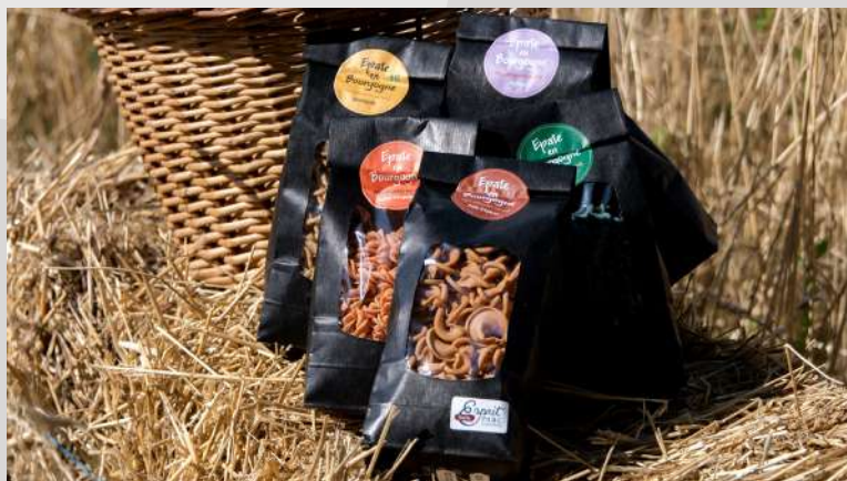
Epate en Bourgogne