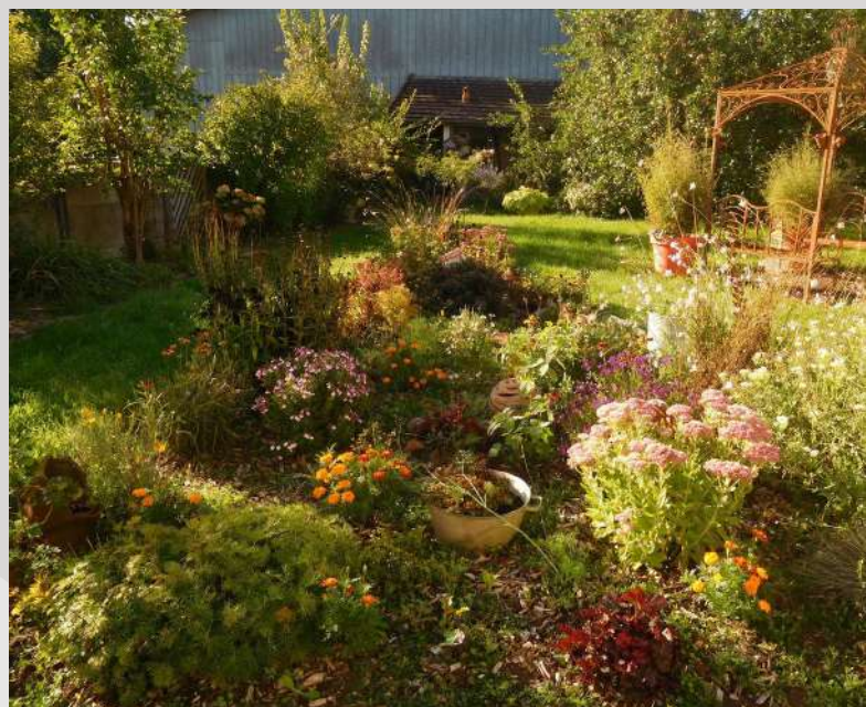
Les jardins du Clos St Jacques