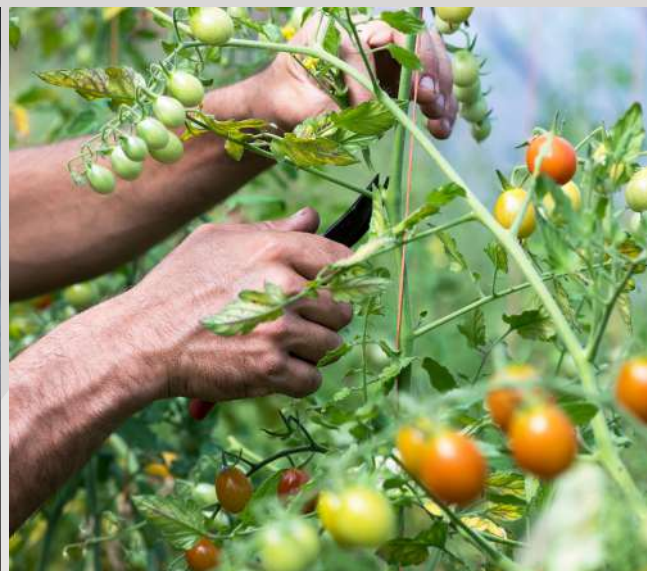
Aujon nos légumes