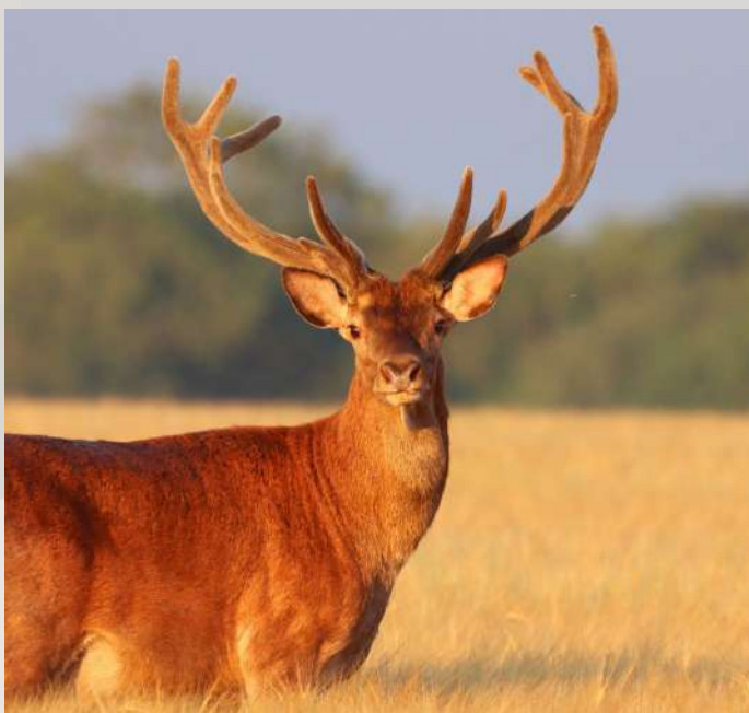
Cerf élaphe © Julien Bouring

Entrez dans un monde de ressourcement... Le Parc national de forêts!