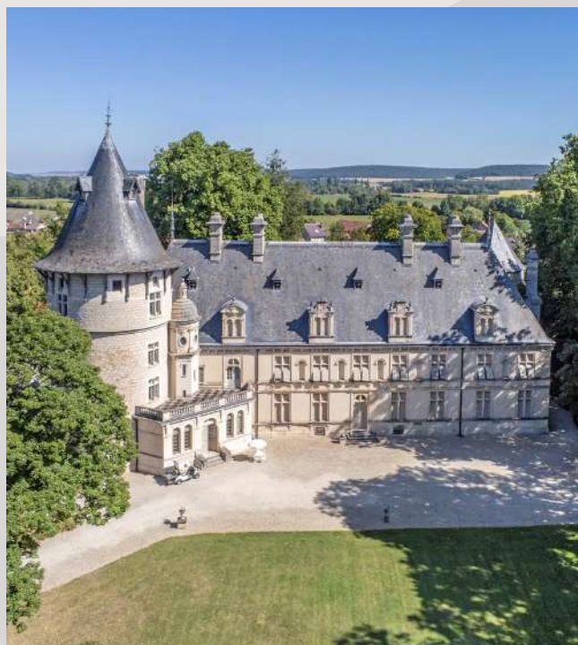
Château de Montigny-sur-Aube