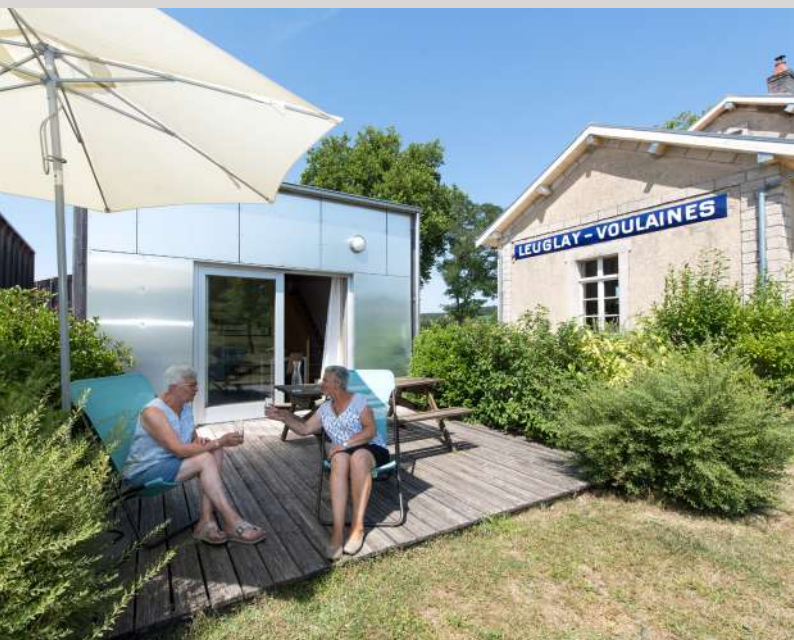
Gîtes de la gare - Leuglay