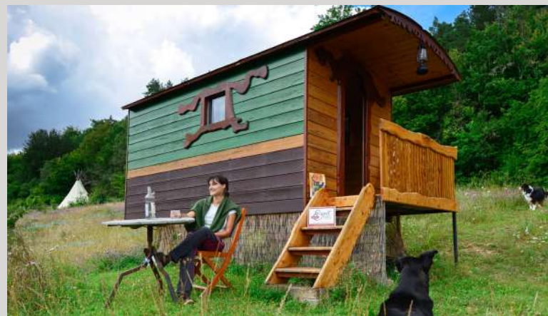
Herberie de la Tille

Une maison idéale pour un week-end reposant, en famille. Tél. : 06 23 68 73 34