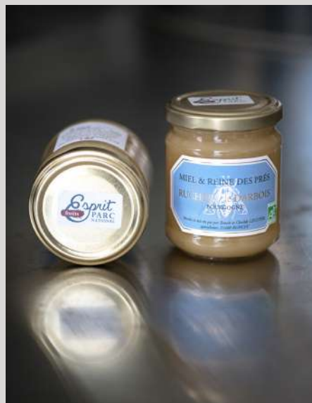
Rucher de Darbois