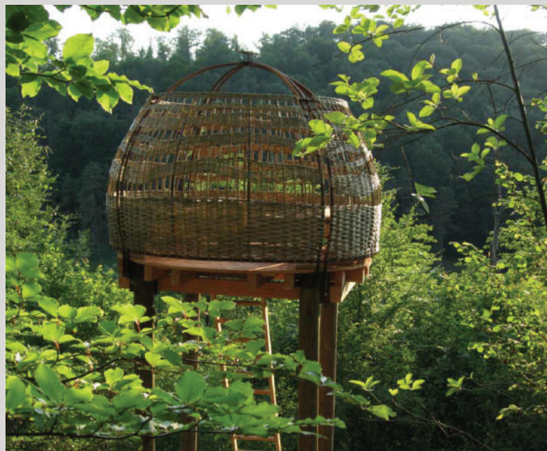
Les nids d'Amorey